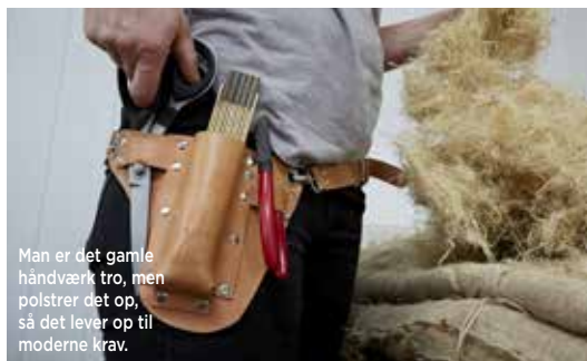
Man er det gamle håndværk tro, men polstrer det op, så det lever op til moderne krav.

Nye ejere med stor erfaring overtager kendt møbelpolstringsforretning i Charlottenlund. Her får kendte møbelklassikere nyt liv med kvalitetsmaterialer udført med stor passion til det gamle håndværk.